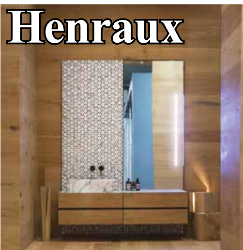
Henraux La collaborazione della ditta Henraux di Querceta (LU) con i designer olandesi Scholten & Baijings che uniscono il marmo e la resina